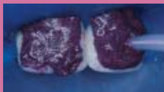
2. Po nasazení kofferdamu se Opalustre nanese na diskolorovanou sklovinu.