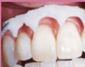
OpalDam je úmyslně křehký, aby se snadno odstraňoval z podsekřivých prostor.