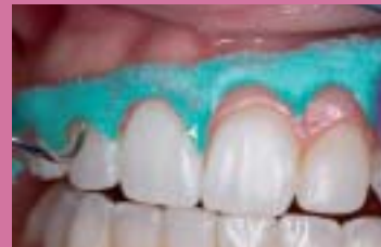
Zelená barva s vysokým kontrastem na gingivu a zuby.