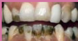
Zabarvení od nikotinu