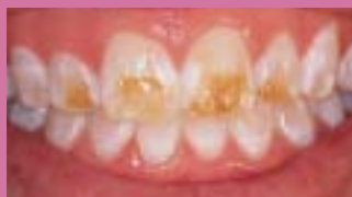
1. Před bělením.