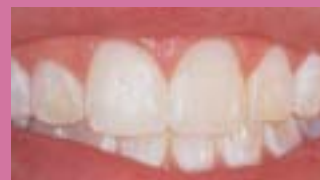
4. Výsledek po mikroabrazi sklovinu a 21-ti denním domácím bělením s Opalescence.