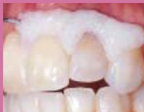
OpalDam se snadno nanáší i odstraňuje. Po nanesení polymerujte světlem 20 sekund.