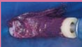
3. Kalíšek se štětiniami přitlačí Opalustre na povrch zubu. Doporučuje se střídatvě oplachovat a kontrolovat výsledek.