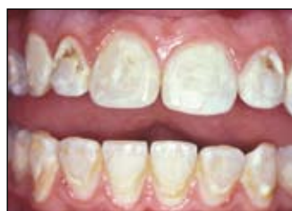
Silné dekalifikace a kazy způsobené špatnou hygienou v průběhu ortodontické léčby. Je doloženo, že aplikace fluoridového laku každých 6 týdnů může významně snížit množství dekalifikací 1 .