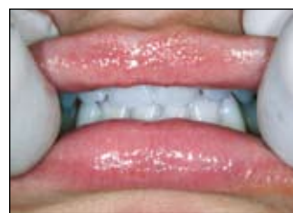
Jemně přetáhněte rty přes povrch zubů tak, aby slina reagovala s lakem. Lak ztuhne po kontaktu se slinami a zůstane na místě nanesení několik dnů až týdnů.