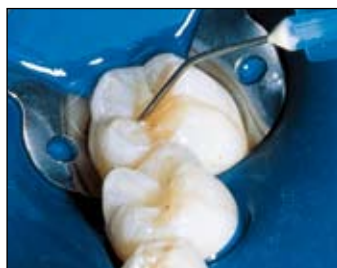
Osušte vzduchem a naneste PrimaDry.