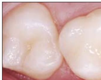
Kvalitní pečetení. Ohromná služba pro pacienty každého věku.