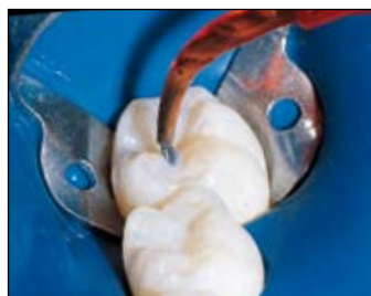
UltraSeal XT plus.