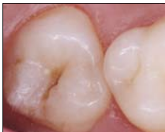
Hluboké, rizikové rýhy a časně léze.

Ideální viskozita: Ultra Seal XT plus je zatékavý při aplikaci kanylou Inspiral Brush, ale pevný po nanesení. Na rozdíl od běžných kanyl, nanesení materiálu kanylou Inspiral Brush do fisur zabraňuje vzniku vzduchových bublin. Naplnění z 58% poskytuje zvýšenou stabilitu a odolnost proti abrazi. Použijte PrimaDry (viz odstavec níže) jako přípravný úkon, který z fisury odstraní veškerou zbytkovou vlhkost a umožní perfektní penetraci UltraSeal XT plus. 3