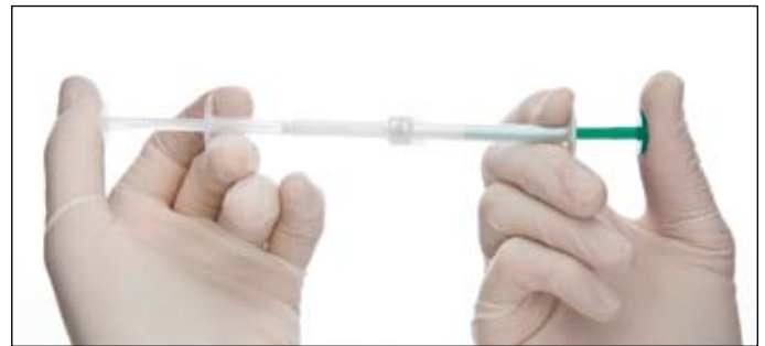
Promíchejte obsah stříkačky přetlačením materiálu z bílé stříkačky do čiré 5x tam a zpět. Před nanášením přetlačte lak do bílé stříkačky.

Ohebná kanyla FX Flex se štětečkem na špičce umožní snadnou plynulou aplikaci laku na všechny požadované zubní plochy.