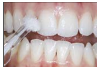
Osušte zuby před aplikací. Vytlačte malou kapku na špičku kanyly. Rozetřete do tenké vrstvy na ošetřovaný povrch.