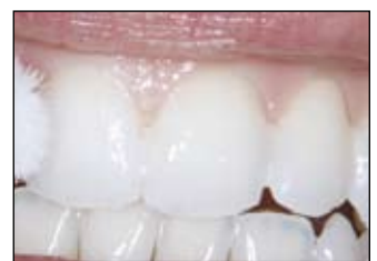
Nečistěte zuby nebo nežvýkejte a nekousejte tvrdé potraviny 4-6 hodin po ošetření.