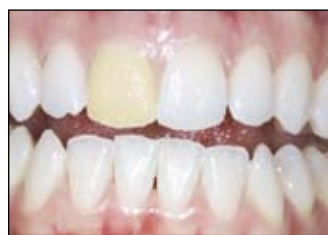
Typické laky jsou žluté - viz pravá horní jednička. Flor-Opal Varnish je esteticky bílý - viz ostatní horní řezáky.