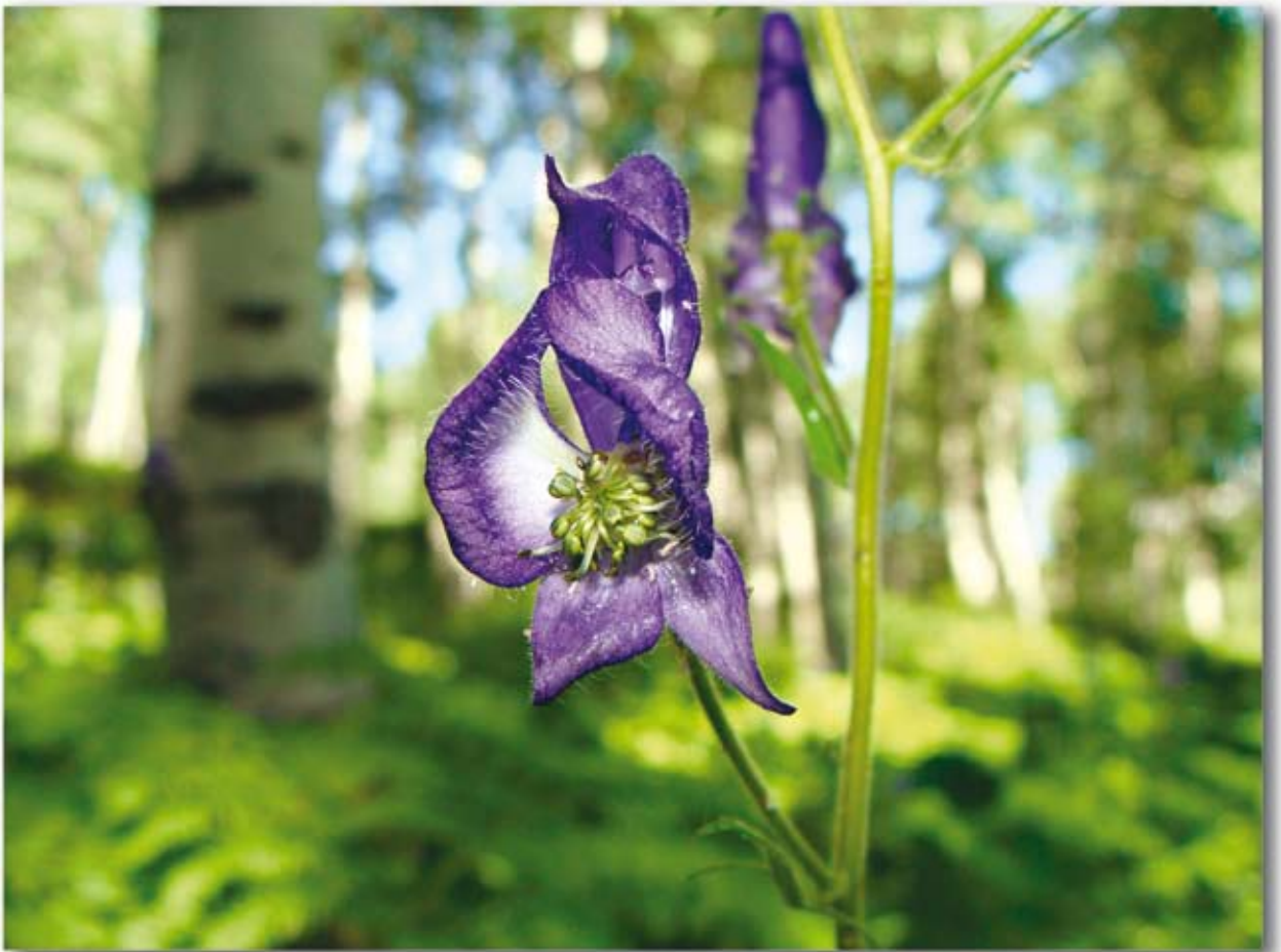
Alpský kosatec ve Wasatch Range

Opalescence bělicí zubní pasta • Flor-Opal Varnish bílý • Universal Dentin Sealant • Ultrapro Tx profylaktická lešticí pasta