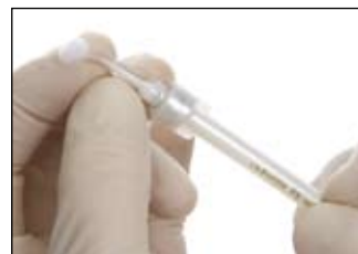
Pevně našroubujte kanylu FX Flex a pokud je to třeba, ohněte špičku kanyly o 90°. Lak nemůže volně protékat, jestliže je kanyla ohnuta příliš.