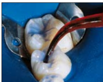
Ultra-Etch 15 sekund, opláchněte.