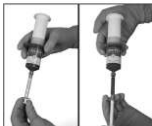
Obrázek 1 a 2: Stříkačka 1,2ml je pevně našroubována na stříkačku IndiSpense. Zatímco popíráte píst jednorázové stříkačky nedominantní rukou, stlačte píst IndiSpense a naplňte jednorázovou stříkačku do požadované úrovně.

POZNÁMKA: Bezpečnostní list a další informace o přípravku Ultra-Etch najdete na www.ultradent.com .