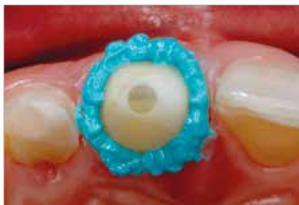
Nanesená VOCO Retraction Paste