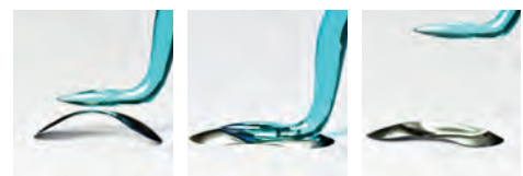
Sekční matrice z nerez oceli