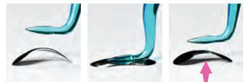
QuickmatFLEX titanové sekční matrice

porovnání QuickmatFLEX sekčních matic a sekčních matic z nerez oceli