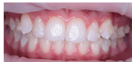
Shannon Pace Brinker, CDA CDD The Whitening Shop, Virginia Beach, VA

Použití vysoce odolných kompozitních materiálů pro attachmenty při terapii průhlednými alignery zajišťuje jejich spolehlivost po celou dobu léčby. Díky těmto vlastnostem attachmenty odolávají silám vznikajícím při pohybu zubů a minimalizuje se jejich opotřebení.